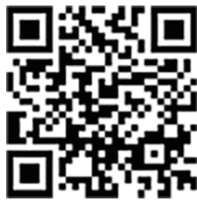
[ 官网了解更多 ]